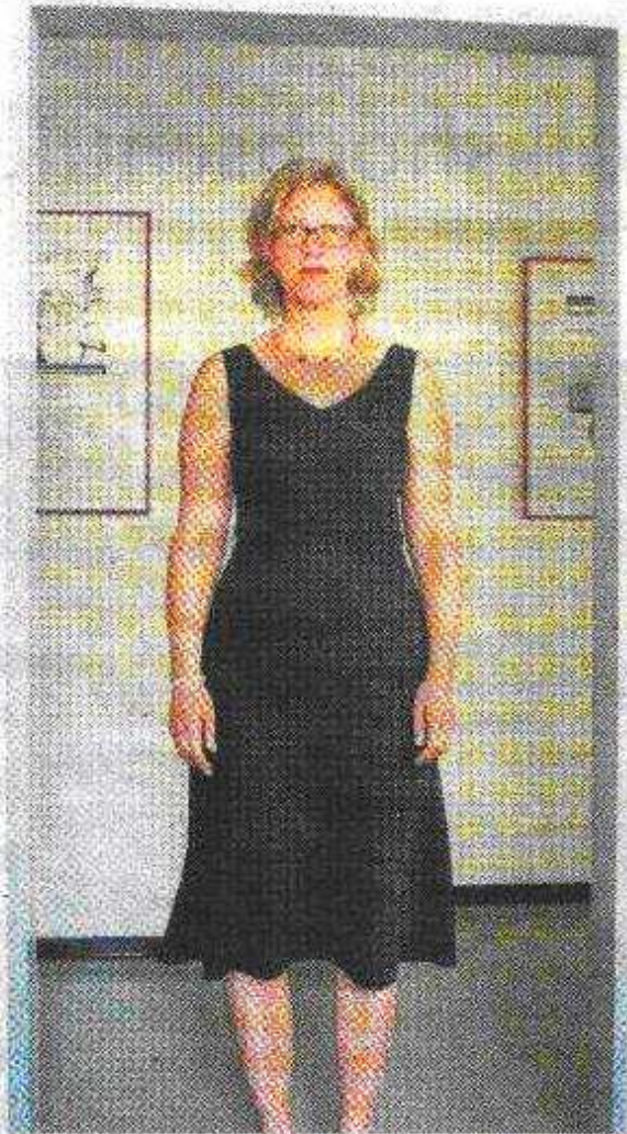
Zwei Auftritte einer Frau, wenn sie ins Büro einer Kollegin kommt, um eine Frage zu stellen: Auf dem linken Foto wirkt die Frau lieb und unterwürfig, auf dem rechten, in der Mitte des Türrahmens, machtvoller.